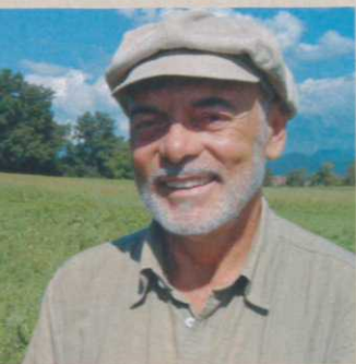
Piše: ANTON KOMAT