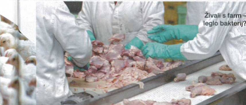
Živali s farm – leglo bakterij?