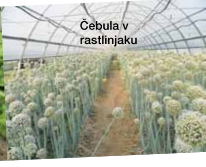
Čebula v rastlinjaku