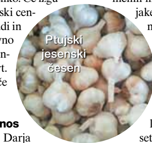
Ptujski jesenski česen

korodne sorte kmetijskih rastlin, globalizacija s transportnimi potmi in trgovino pa nam nudi hrano iz vsega sveta. Kaotične podnebne spremembe in politična nasprotja v svetu pa so vzroki, zaradi katerih se upravičeno sprašujemo, kako poskrbeti za hrano v prihodnosti. Selekcijsko-poskusni center Ptuj z največjim oglednim vrtom avtohtonih in udomačenih sort ima velik pomen, tako v prenosu znanja o se-